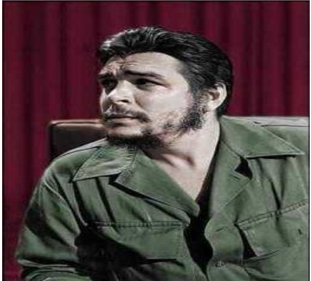
Ernesto Guevara de la Serna

Llegará el día en que los derivados de la caña de azúcar tengan tanta importancia para la economía nacional, como la que hoy tiene el azúcar.