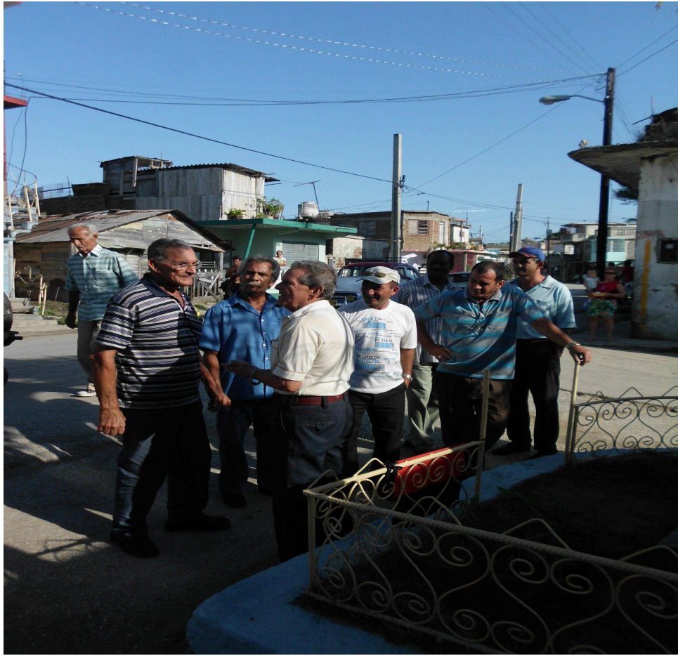
Combatientes el día 30 de diciembre del 2011 en el acto de recordación de su muerte.