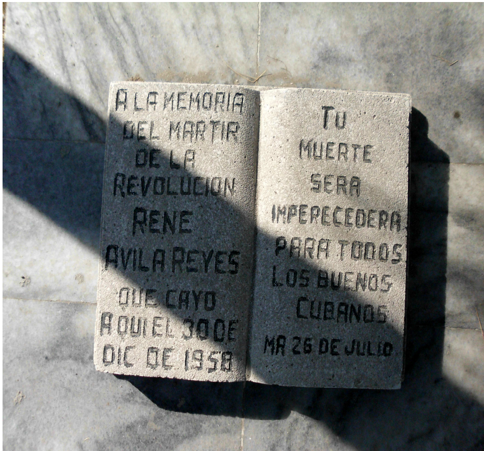
Libro del obelisco.