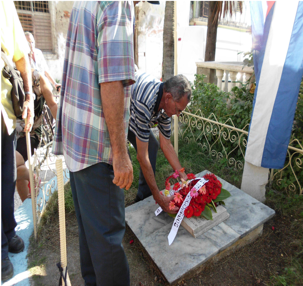
Dos combatientes depositando una ofrenda floral en recordación a su fallecimiento 30 de diciembre de 2011.