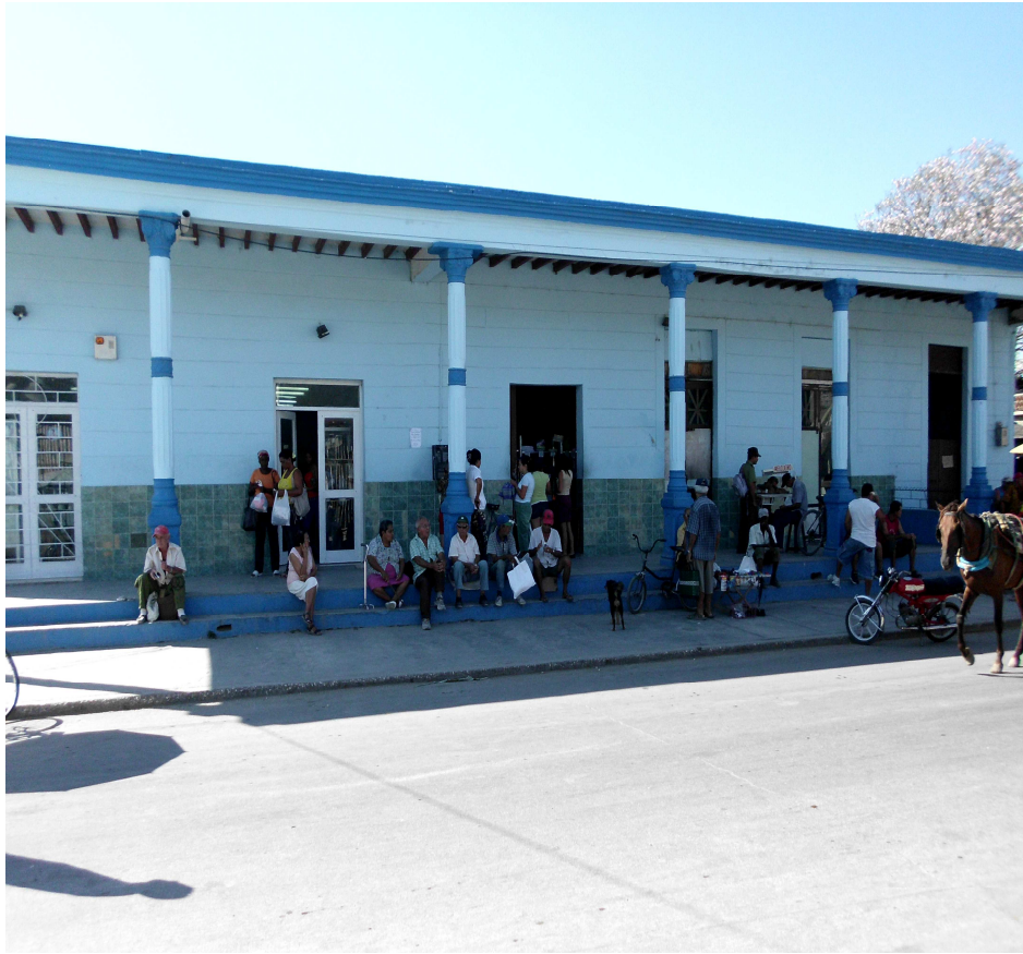
TRD Vista Alegre de la calle Nicio García, antiguo almacén de granos.