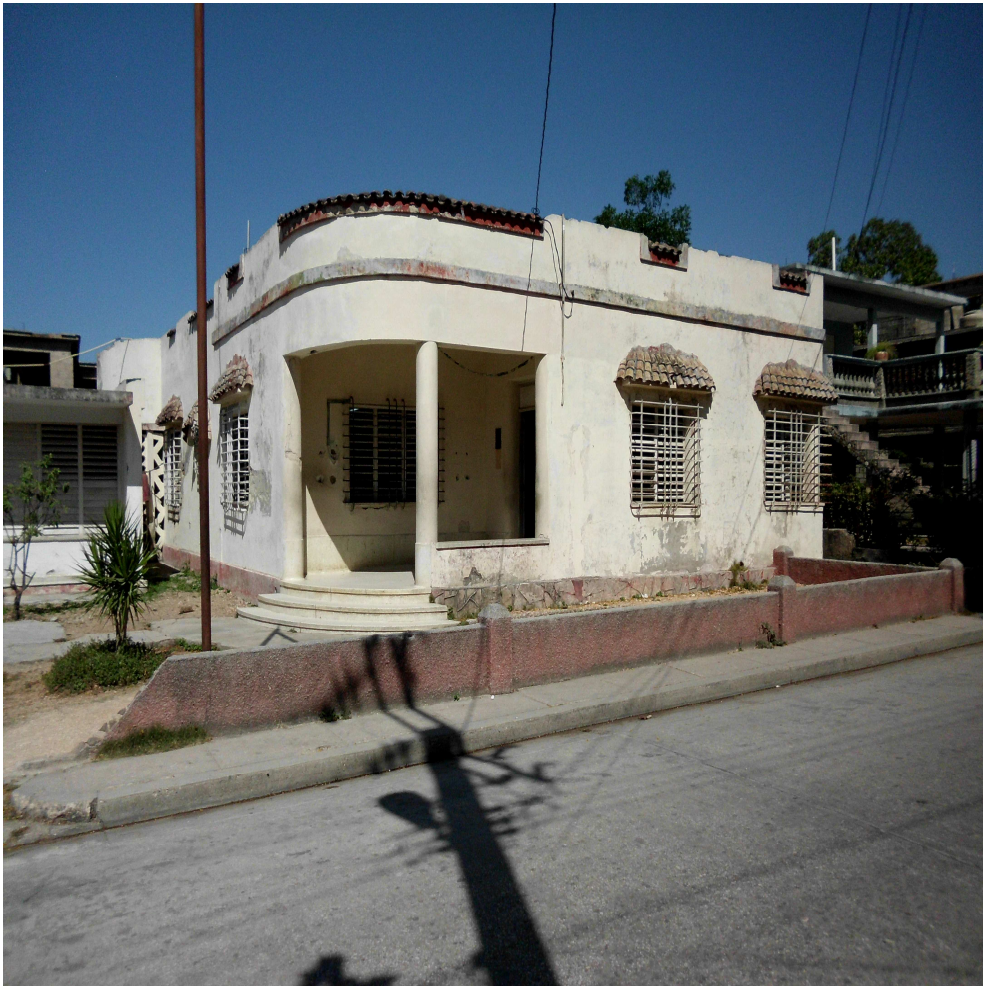
Policlínico René Ávila Reyes.