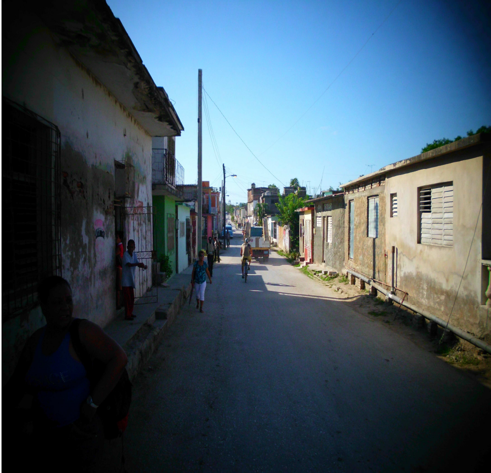
Calle que lleva su nombre René Ávila Reyes.