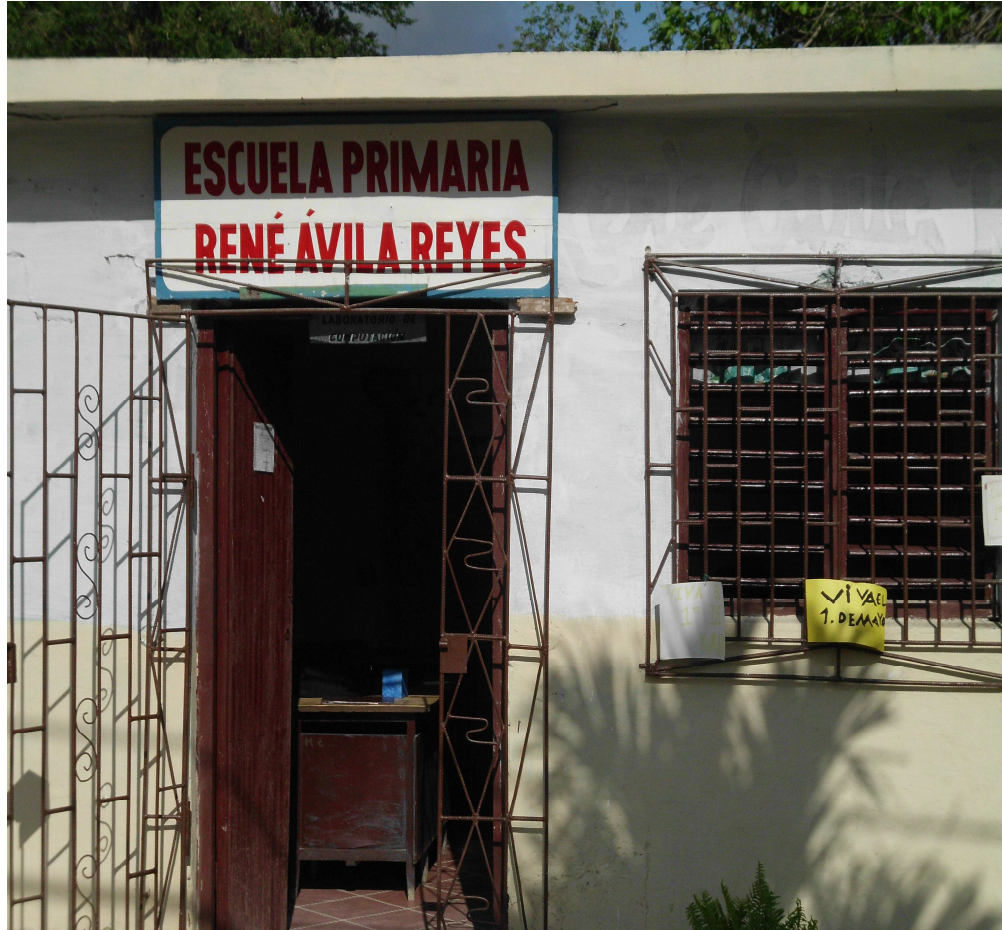
Escuela que lleva su nombre en el reparto Alcides Pino.