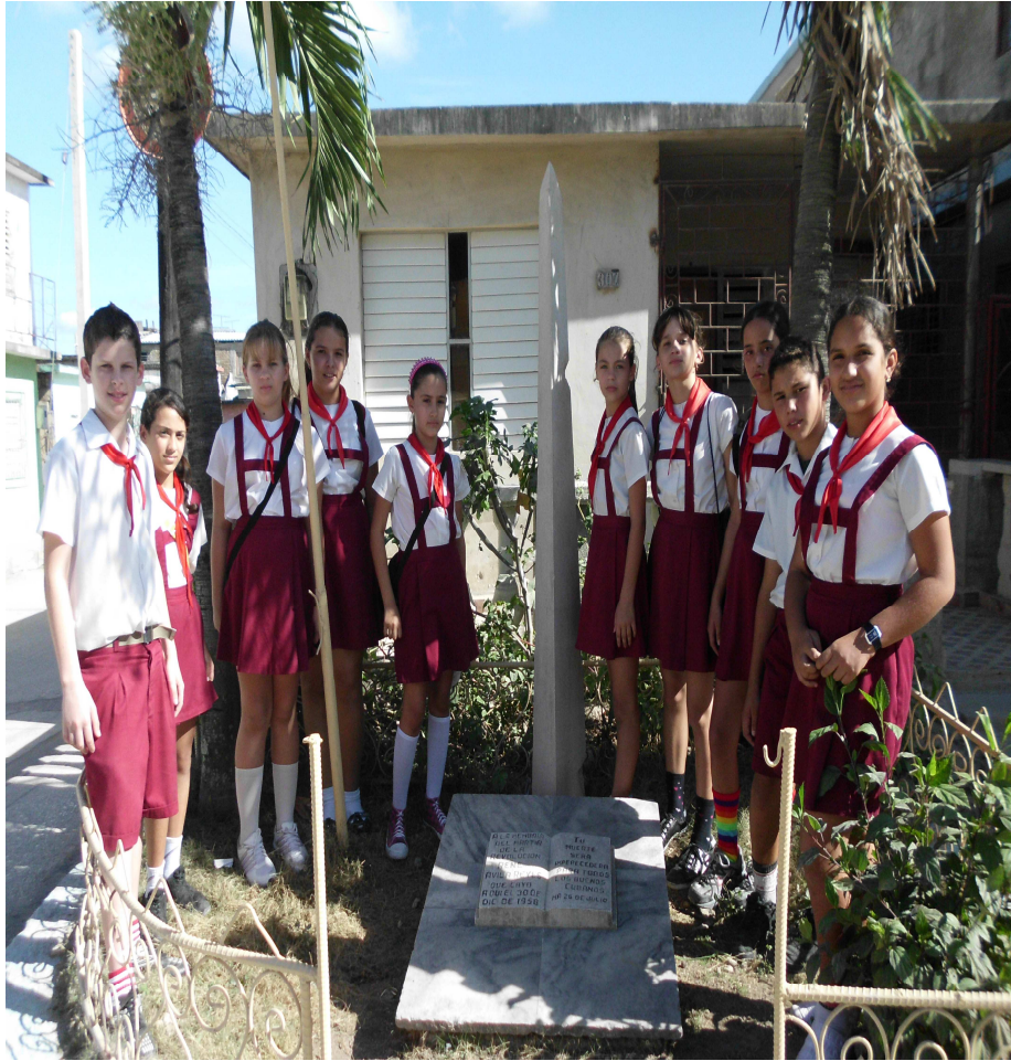
Estudiantes de la escuela primaria Lucía Iñiguez Landín realizando actividades de limpieza y embellecimiento al obelisco.