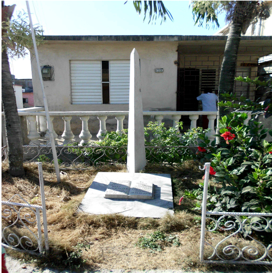
Obelisco situado en la calle Nicio García esquina René Ávila Reyes, Reparto Vista Alegre.