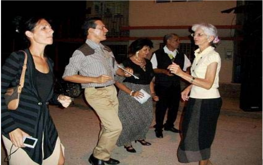
ARTICIPACIÓN DE TODOS LOS GRUPOS ETÁREOS DE LA COMUNIDAD