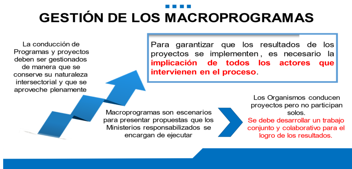
Figura 2. Gestión de los macroprogramas