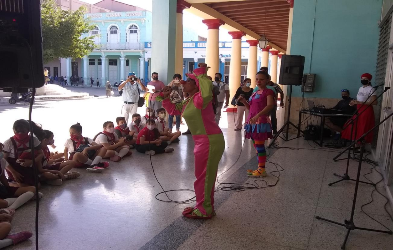
- Actividad con discapacitados.