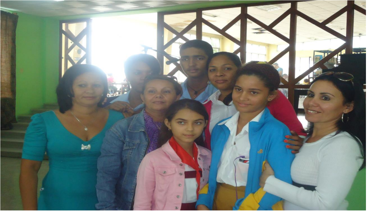
- Actividades de la UNICEF.