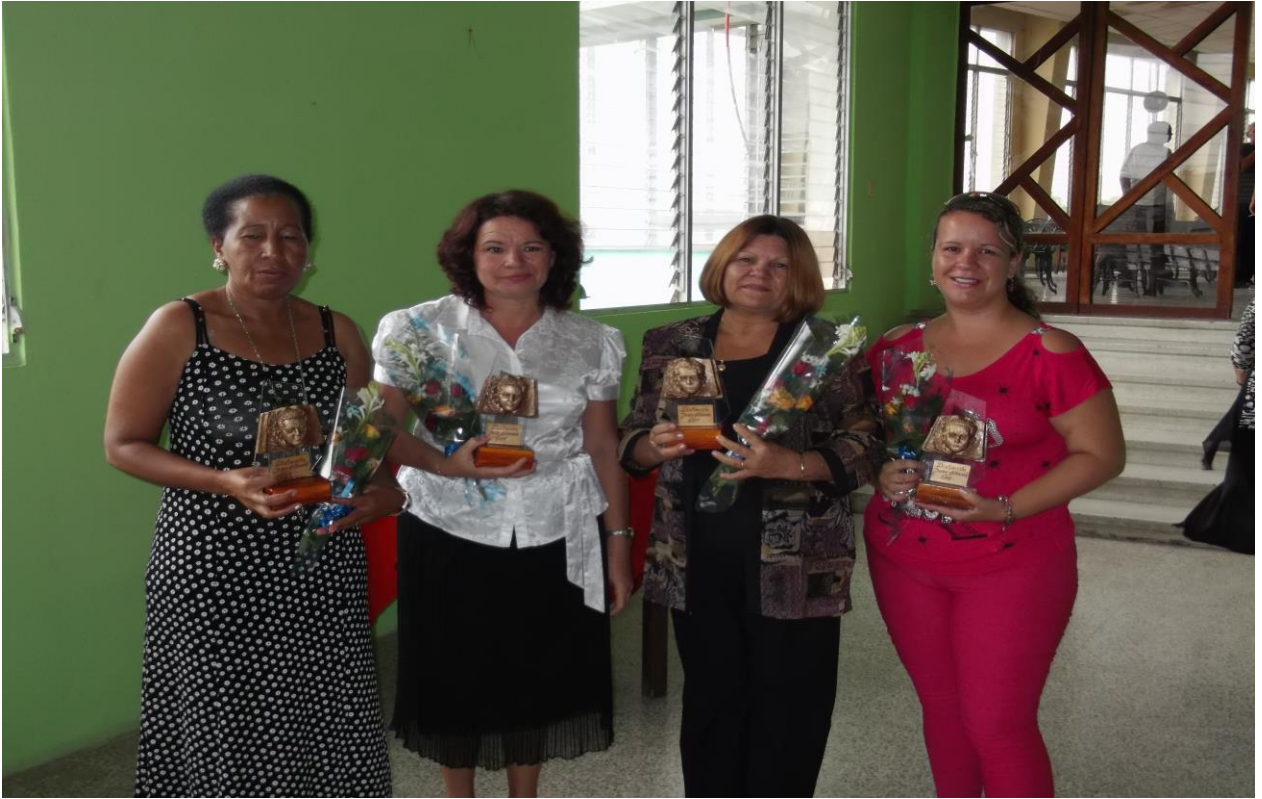
- Concurso "Leer a Martí".