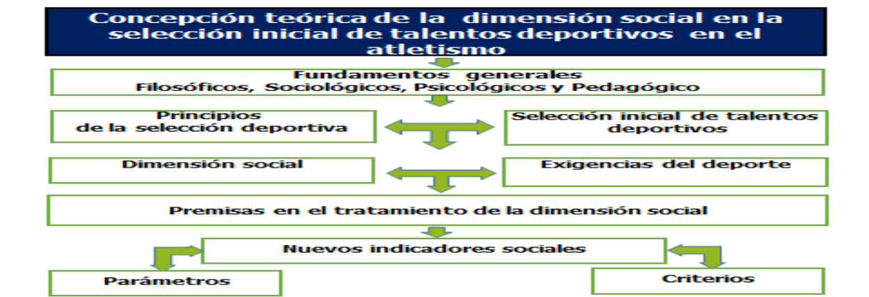
Figura no. 1. Representación gráfica de la concepción teórica

En esta nueva cualidad para el tratamiento de la dimensión social, fue necesario partir de la sistematización de la teoría del capítulo 1 y el complemento necesario del capítulo 2 en el momento de la construcción de la concepción, donde se declaran los postulados esenciales a través de las leyes, principios, premisas, exigencias del deporte y los fundamentos de la dimensión y los indicadores, que sustentan la salida práctica de la concepción teórica, a través de la metodología, con vista a la transformación requerida en el objeto de estudio. (Mojena, 2019: 5-8)