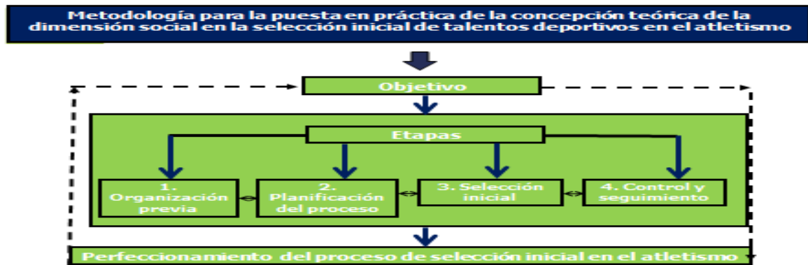
Figura no. 2 Representación gráfica de la Metodología