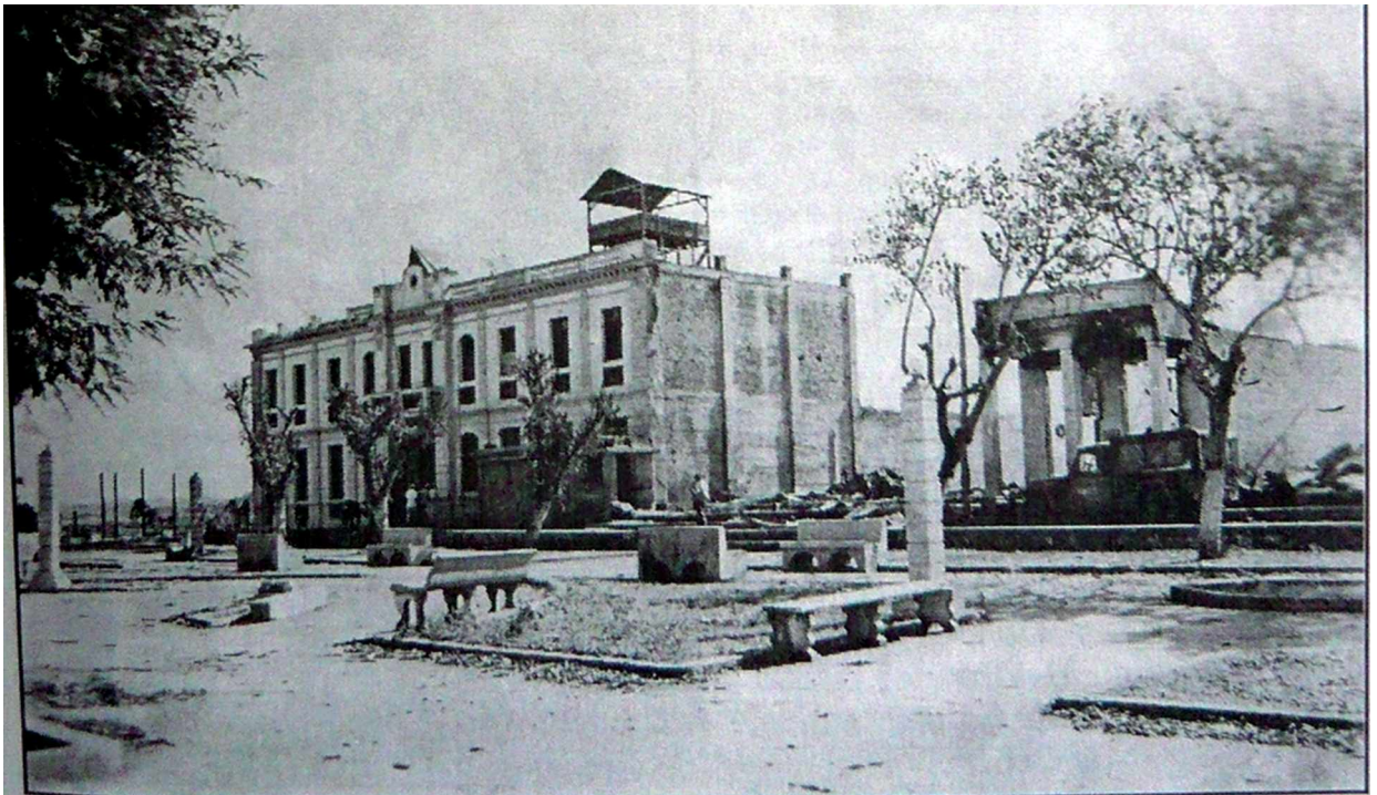
Edificio del ayuntamiento donde se encontraba el puesto de mando de las tropas de la tiranía. En la azotea tenían instalada una ametralladora calibre 50.