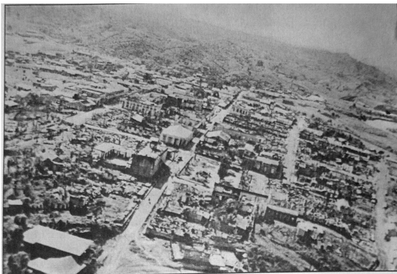
Sagua de Tánamo. Obsérvese el estado en que quedó la ciudad después del ataque.