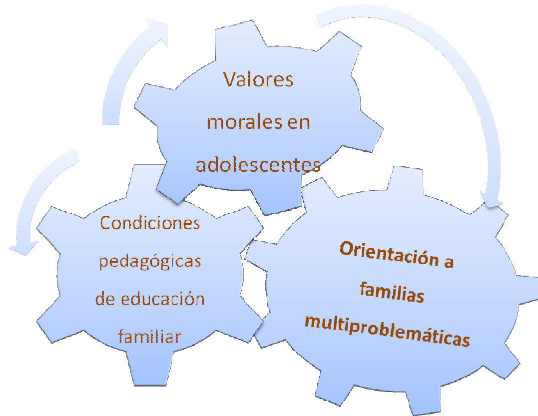
Figura 2. Representación de la dinámica del proceso de orientación.