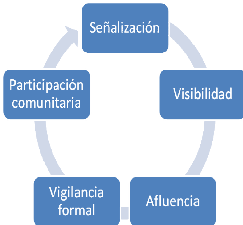
Figura 3. Fases en las que se organizan las acciones de intensidad variable para la orientación a familias multiproblemáticas.