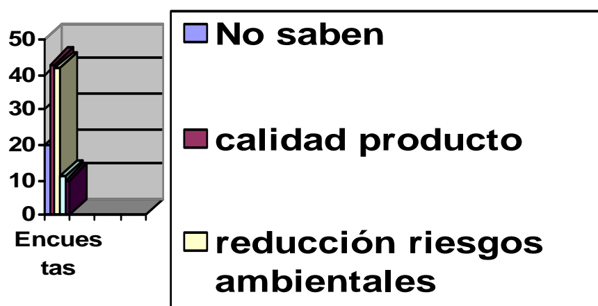
Gráfico 1. Gráfico de barras con resultados de la pregunta 1 de la encuesta a trabajadores

cuestión y por lo tanto tampoco ven una implicación directa como actores activos dentro del proceso. Es interesante como se muestra en el siguiente gráfico de barras (gráfico 1) como el número de encuesta es superior para este caso con respecto a otros que de alguna manera están sensibilizados.