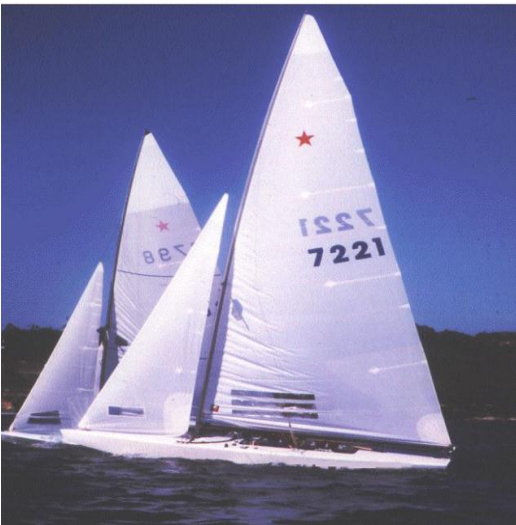
Star o Estrella