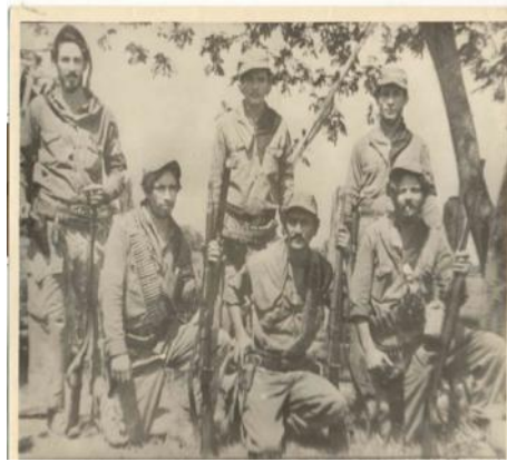
Columna 14 del 4to Frente