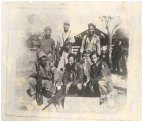
Columna 14 del 4to Frente