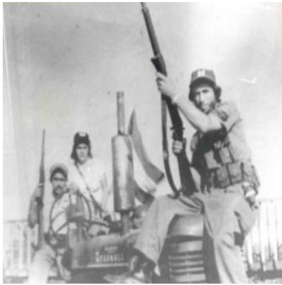
Miembros del 4to Frente