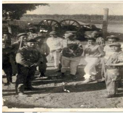
Columna 14 4to Frente