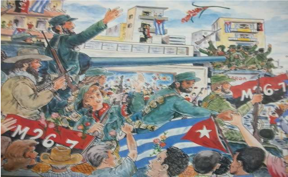
Entrada de Fidel a la Habana