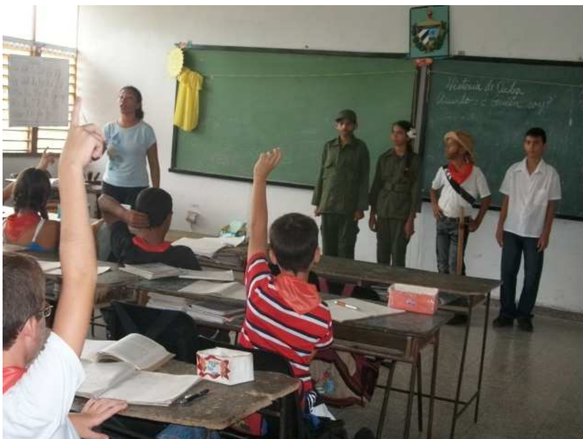
Anexo # 7