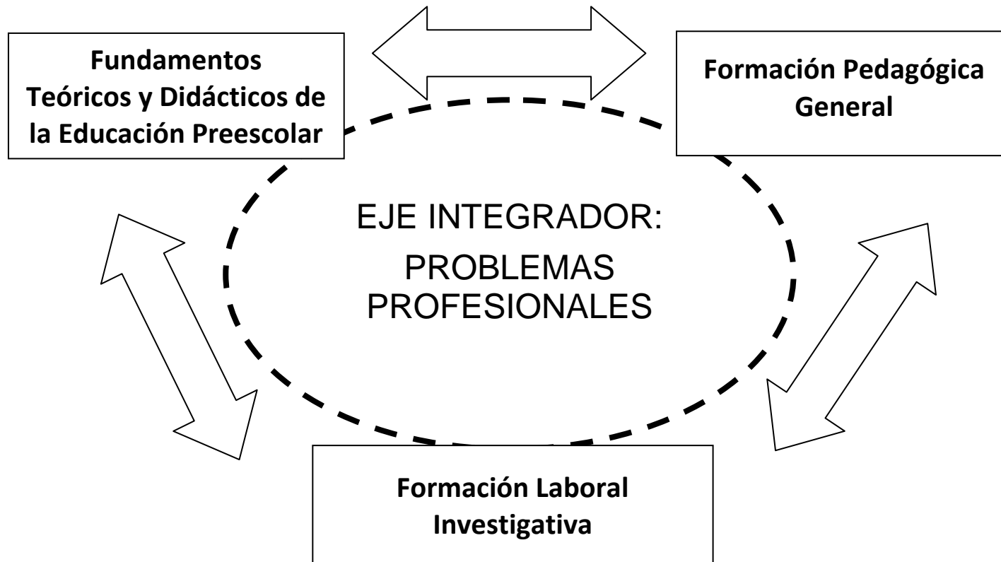
Figura 1. Representación gráfica de la dimensión docente-laboral