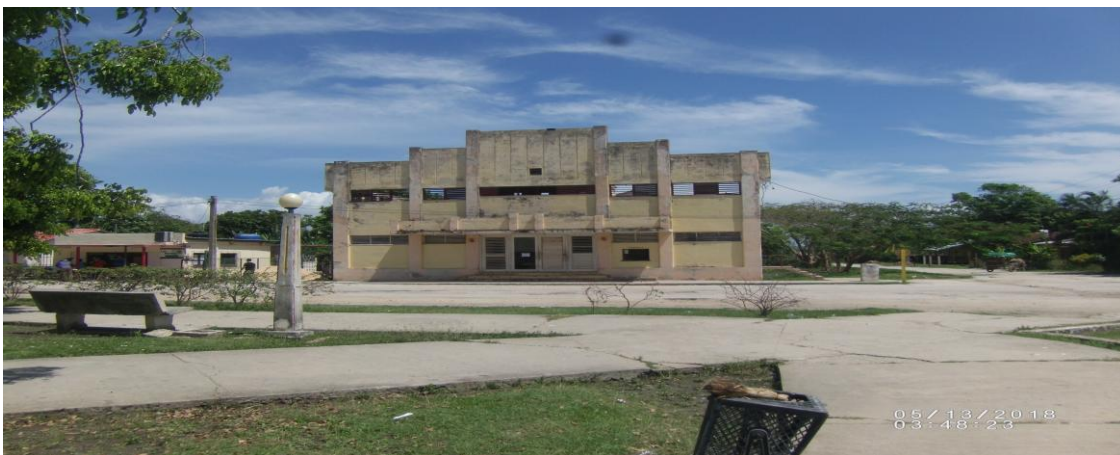
Cine Guatemala a principios de 2018.