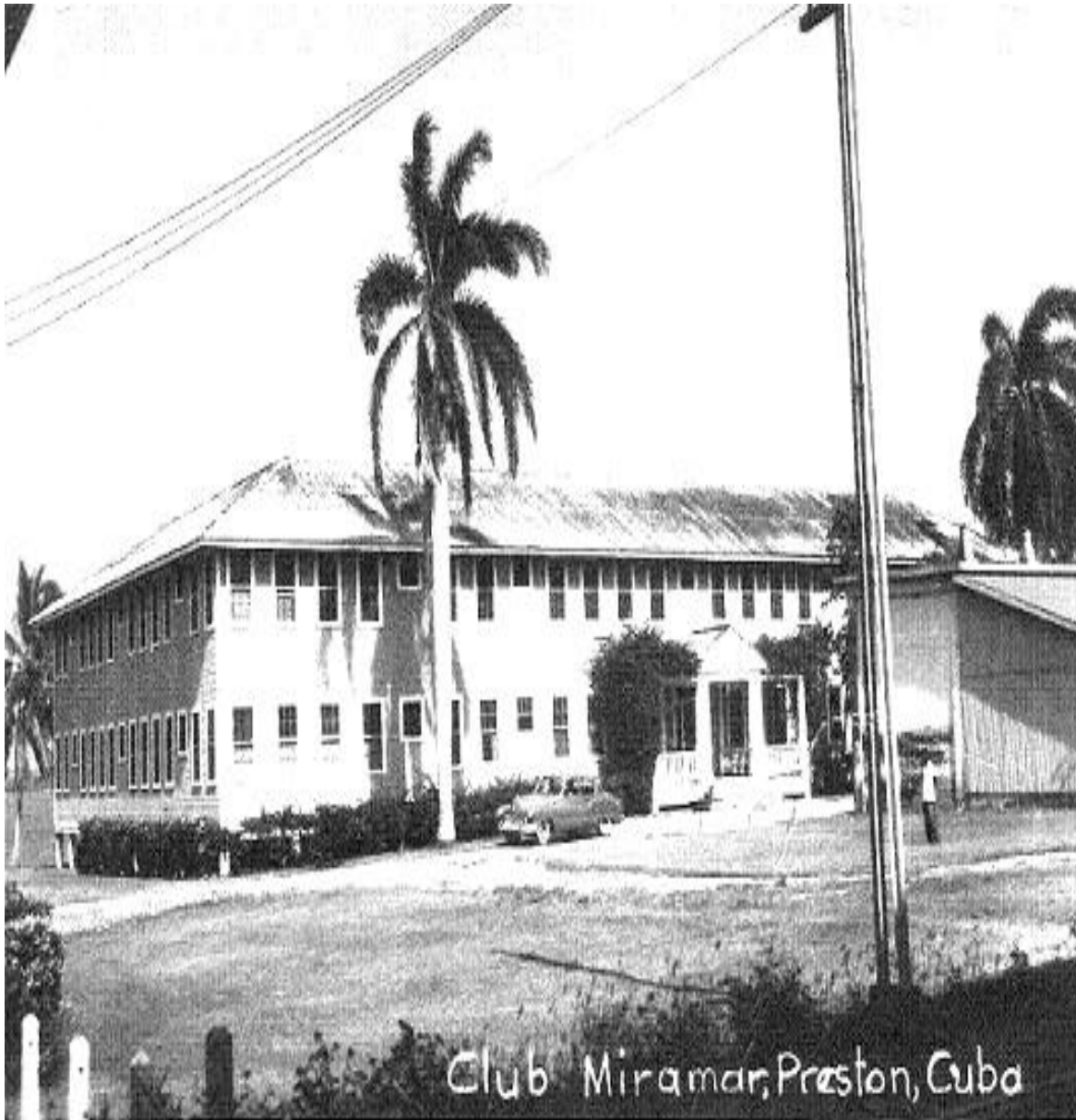
Hotel Club Miramar en los años cincuenta del siglo XX

Anexo 2. Lugares del Central Preston vinculados al capital norteamericano y reflejaban las exclusiones sociales.