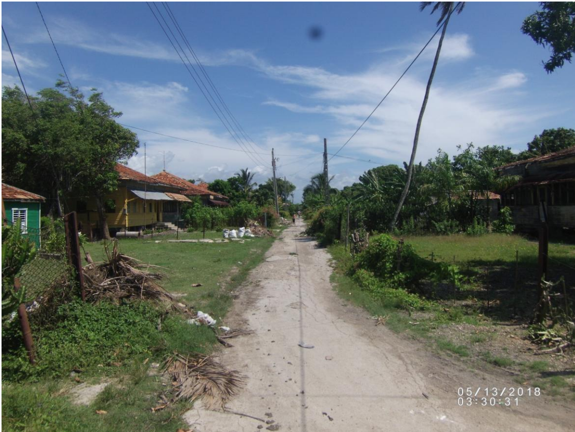
Avenida Americana en la actualidad.