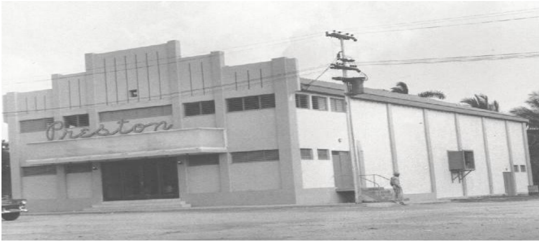
Cine Guatemala -antiguo Preston –a inicios de la Revolución.