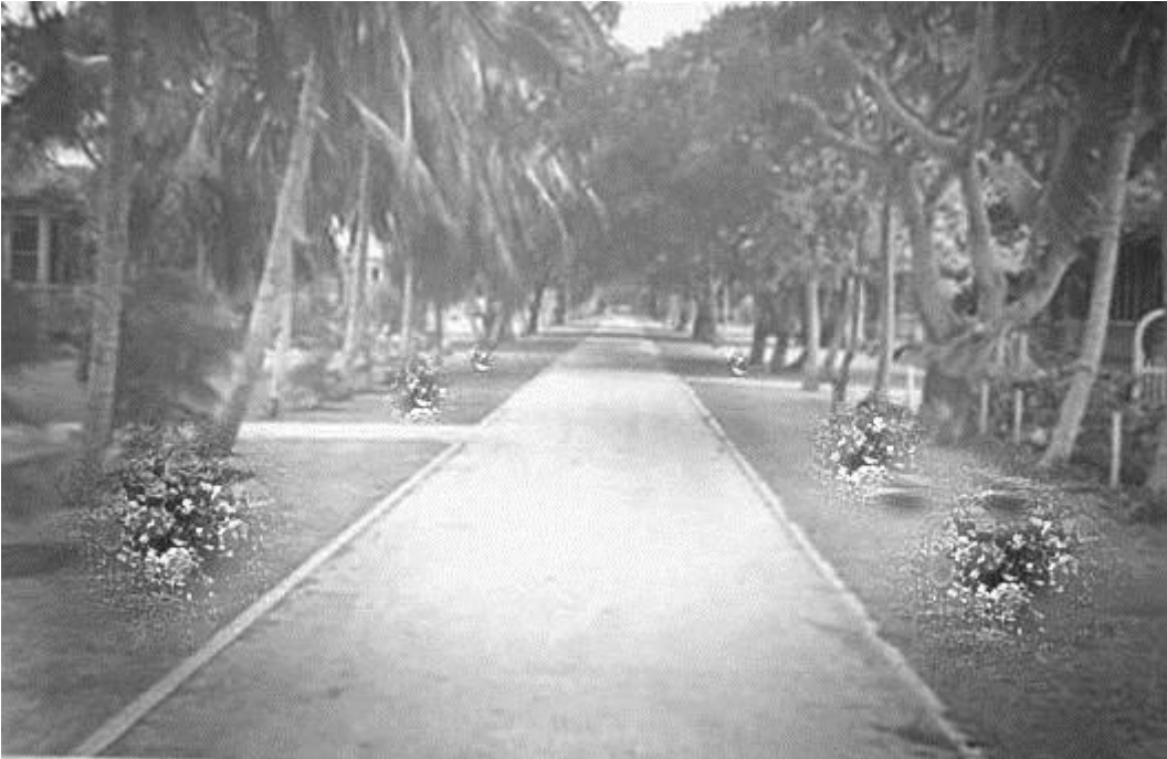
Avenida Americana hacia la década del cincuenta e inicios de los sesenta.