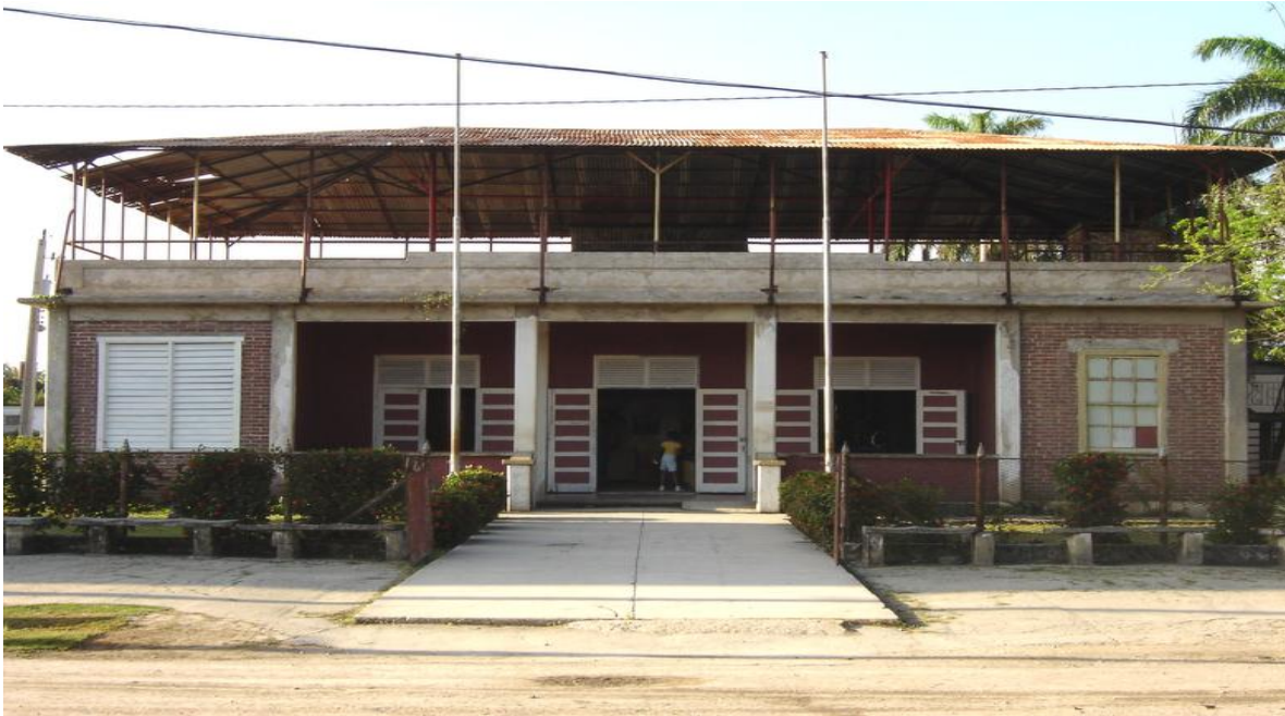
Casa de la Cultura en 2010.

Anexo fotográfico 12. Casa de la Cultura de Guatemala en dos tiempos, muestra de los esfuerzos por remodelar espacios para el disfrute de la población.