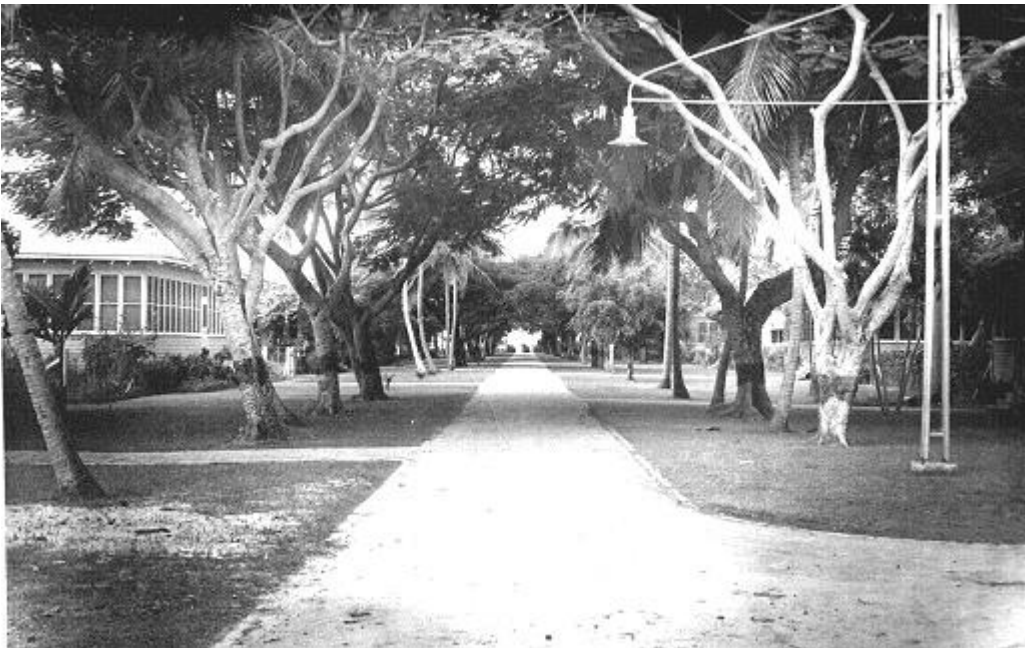
Avenida Americana hacia la década del cincuenta e inicios de los sesenta