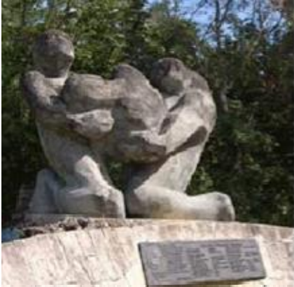
Monumento a los mártires de las Pascuas Sangrientas en la ciudad de Holguín