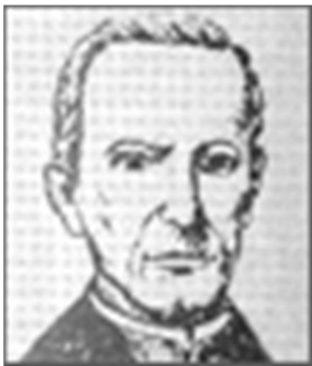
José Agustín Caballero

Los grandes pedagogos iniciadores del movimiento educativo promotor de la identidad cubana, consideraron imposible la ejecución de reformas educacionales relevantes, sin tener en cuenta la enseñanza elemental y mucho menos, sin la aplicación de métodos dinamizadores del aprendizaje de los niños. En esa época, los procedimientos empleados en la enseñanza de la lectura eran muy rudimentarios, lo cual obstaculizaba el crecimiento intelectual de los escolares.