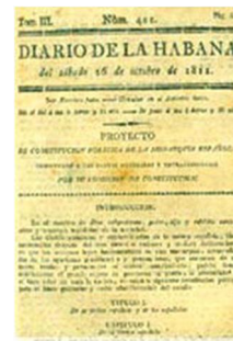
Diario de La Habana

“Todo el mundo sabe que en sus primeros rudimentos pueden enseñarse de dos modos, esto es, deletreando o silabeando. Y aunque se da la merecida preferencia a este último sistema por ser más fácil y expeditivo para la generalidad de los alumnos, hay niños, sin embargo, a quienes ofrece menos dificultades el deletreo que el silabeo” . 8