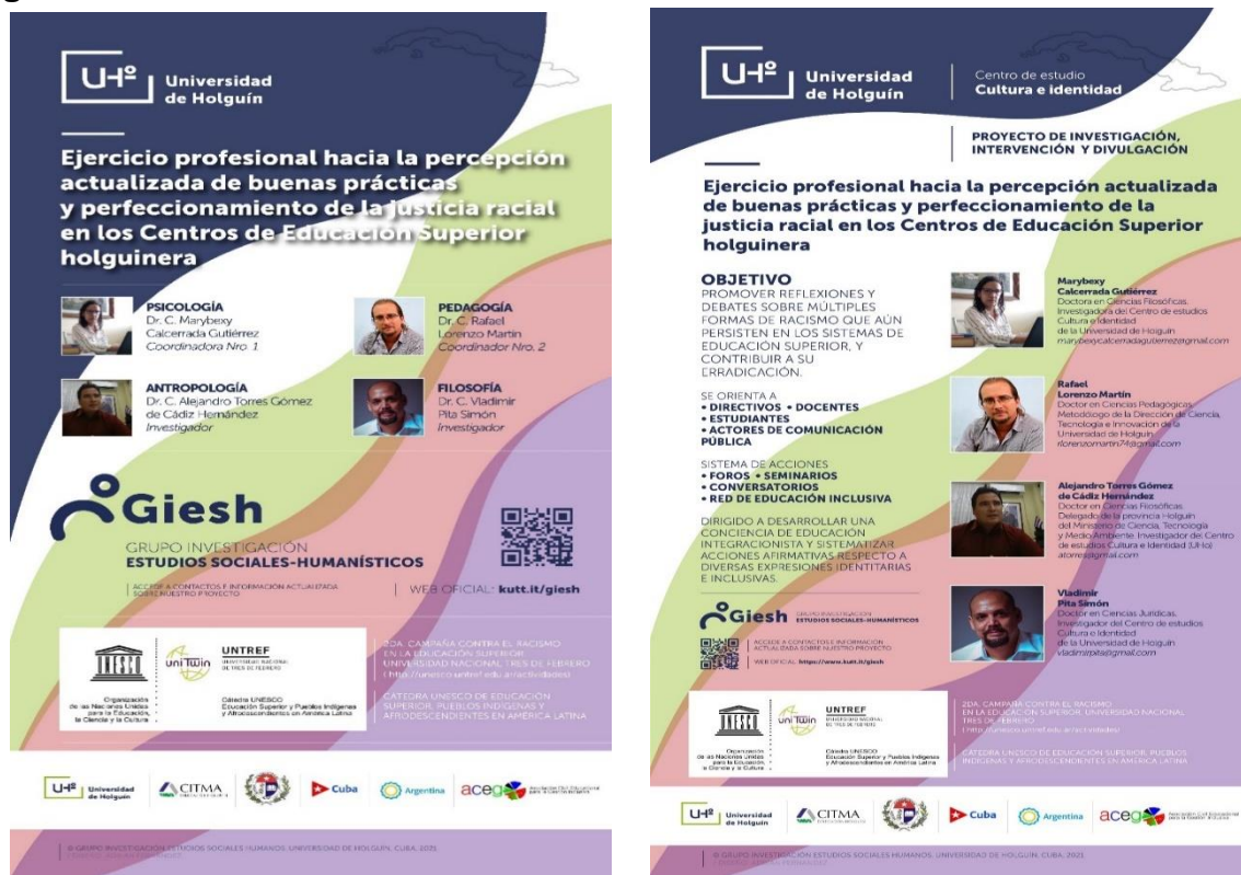
Figura 1. Carteles divulgativos del Proyecto UNESCO de la Universidad de Holguín.

Medioambiente de la provincia de Holguín. Ambos hacen valiosos aportes desde la Filosofía, Ciencias Jurídicas, Etnografía y la Antropología.