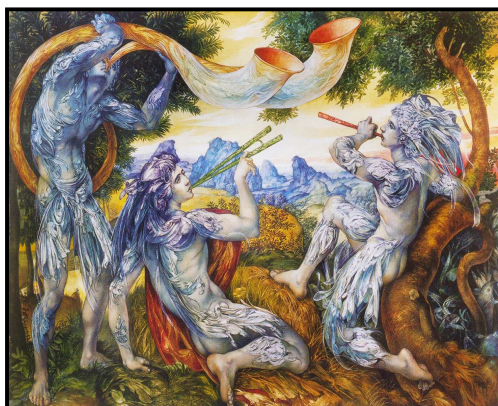
Imagen 1. “Los dioses escuchan I”, de Cosme Proenza Almaguer