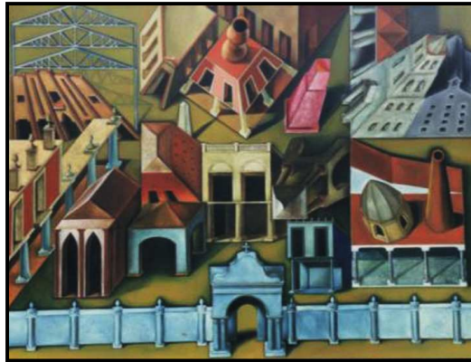
Imagen 3. "En la parte oscura de la ciudad", de Néstor Arena Correas