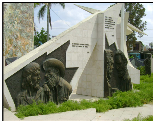
Imagen 5. "Plaza Guevariana"