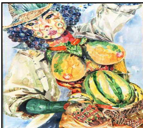
Imagen 7. "Mujer cubana, santa simiente", de Ernesto Ferriol