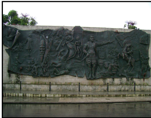
Imagen 4. Mural escultórico "Orígenes"