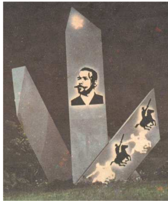
Imagen 4. Conjunto Escultórico. Antonio Maceo. Pinar del Río