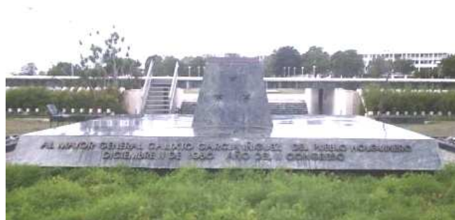
Imagen 5. Mausoleo a Calixto García