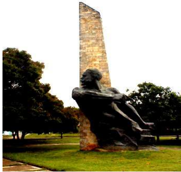
Imagen 3. El Titán de Bronce. Holguín