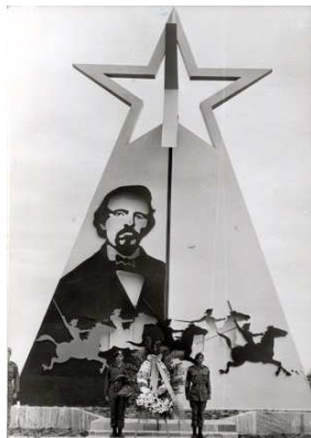
Imagen 1. Conjunto Escultórico a Carlos Manuel de Céspedes