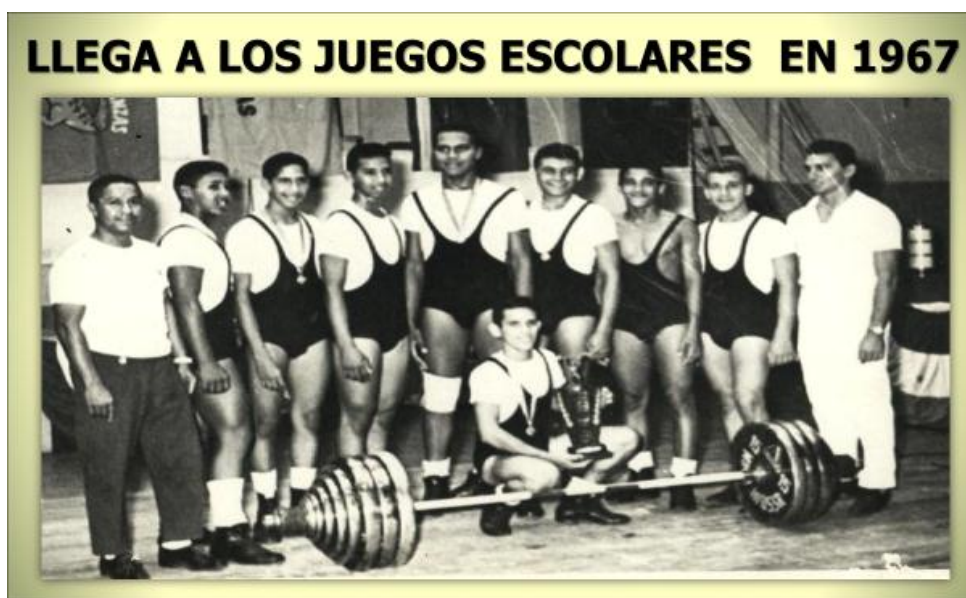
Figura 1. Equipo oriente campeón en los v juegos escolares nacionales celebrados en la habana