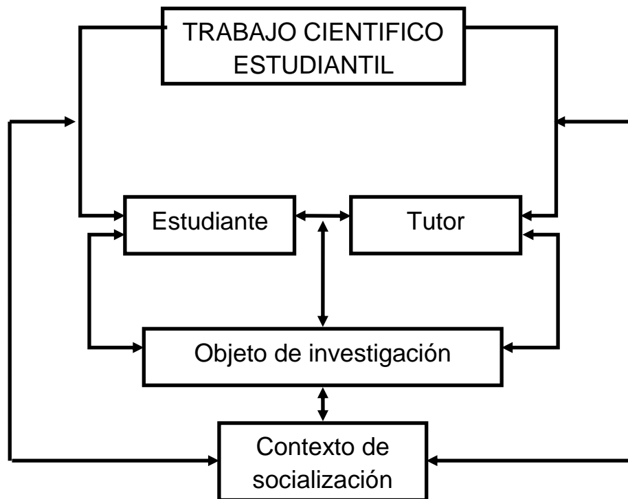
Figura 1 El Trabajo Científico Estudiantil como sistema.

A continuación y a partir de los postulados del método sistémico estructural funcional, se realiza un desglose de cada una de estas categorías para su mejor entendimiento.