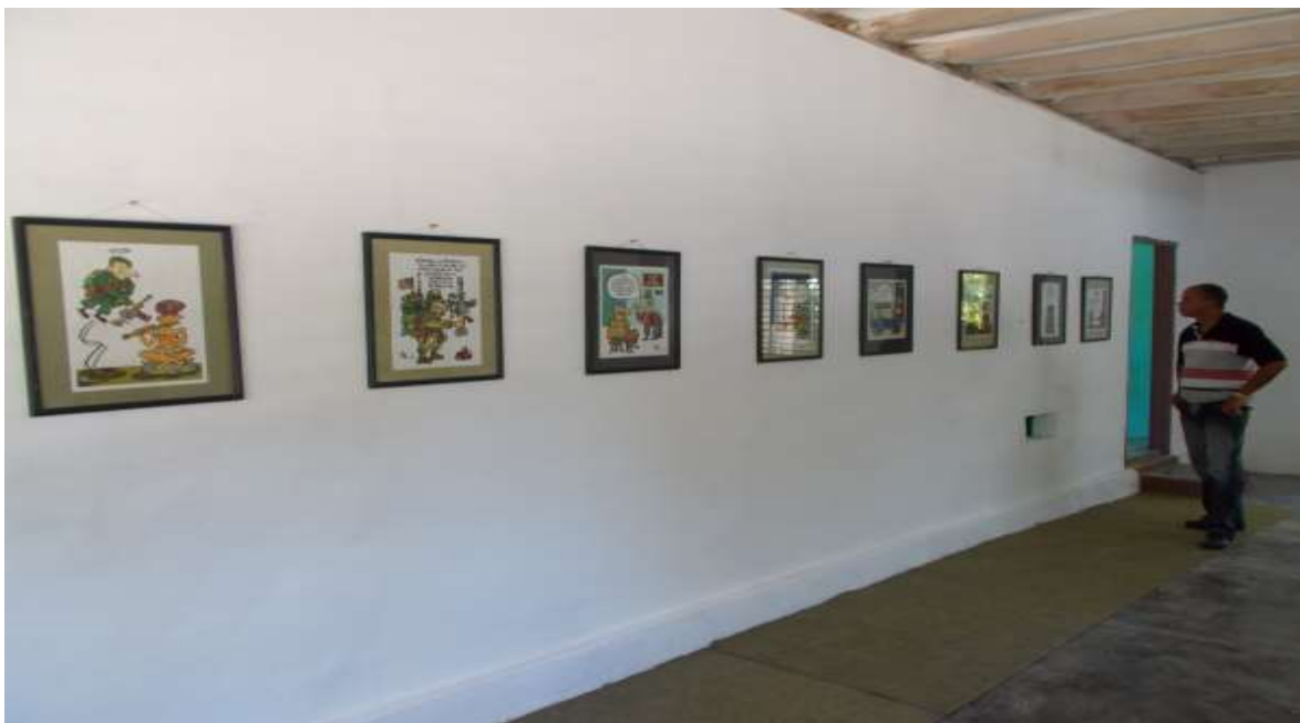
Exposición de las obras de Tomy, colección de 15 piezas donadas en vida.