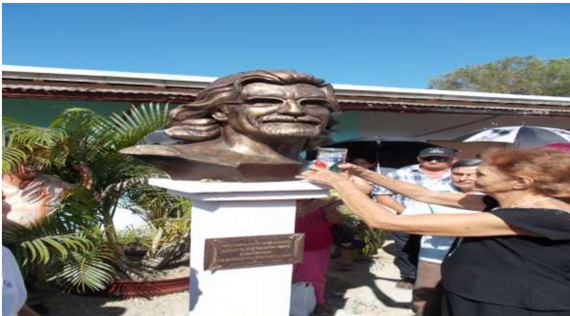
Busto de Tomás Rodríguez zayas a la entrada del Centro promocional