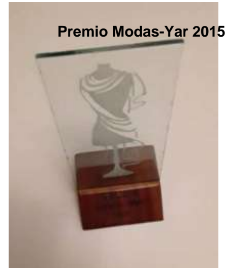
Premio Modas-Yar 2015